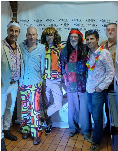
Soirée dansante sur le thème « année 74 »