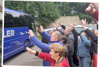
Le départ toujours très émouvant . Comme dit notre ami Karl :

« Il nous faut donc toujours une vingtaine de kilomètres pour que les larmes d'adieu sèchent. »