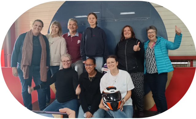
Plus ludique pour d'autres : une séance de karting et de laser game. Rien de tel pour renforcer les liens amicaux dans la joie et la bonne humeur.