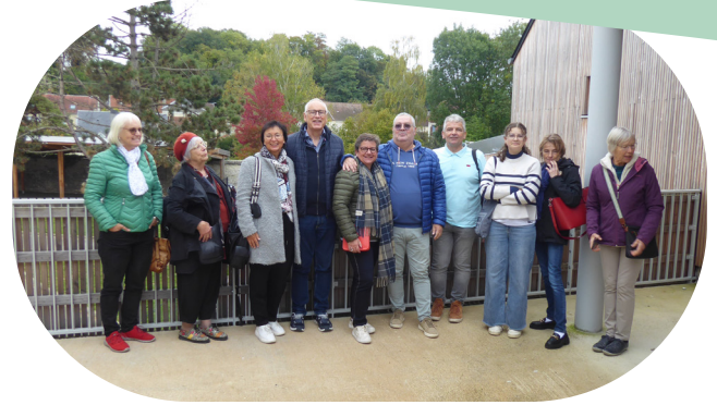
Visite de la médiathèque du château et de l'école maternelle