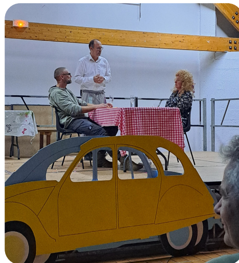
Pièce de théâtre présentée par un petit groupe de la délégation allemande. Sur le thème : les ingrédients d'un bon jumelage sont la patience, la compréhension et la curiosité telle la recette d'un mariage heureux.

La soirée s'est finie dans les familles hôtes, tous et toutes impatients et enthousiastes de partager ces quelques jours ensemble.